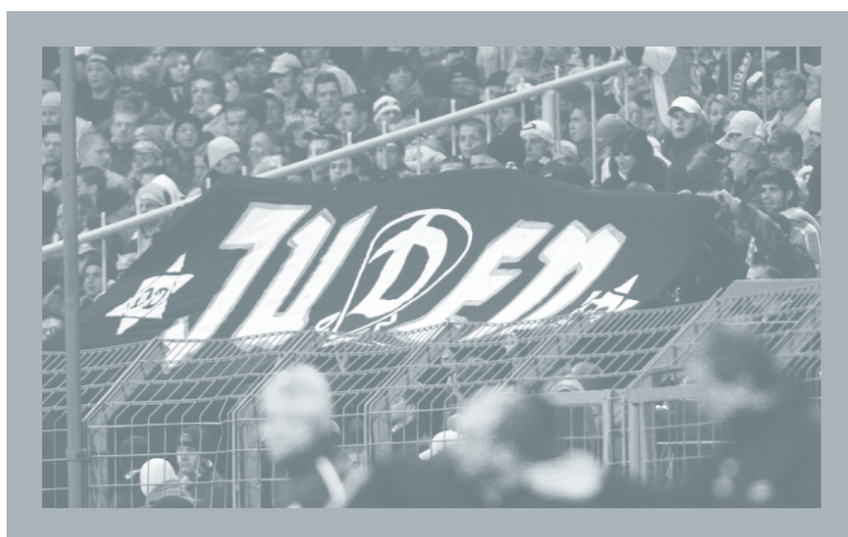
Antisemitisches Transparent Cottbusser Fans, gerichtet gegen Dynamo Dresden im Jahr 2005.

Als Orte, in denen antisemitische Erzählungen über Generationen weitergetragen werden, spielen Fußballplätze eine weitaus größere Rolle als Musikszenen. Die Vereine und Fans von Bayern München, Eintracht Frankfurt, SG Dynamo Dresden, BFC Dynamo Berlin und FC Carl Zeiss Jena erfahren häufig Beschimpfungen als »Judenclubs«. Tatsächlich prägten bei Eintracht Frankfurt und Bayern München jüdische Sportler, Offizielle und Gönner die Vereinsgeschehen in der Zeit vor dem Nationalsozialismus. Beide Vereine standen und stehen in starker lokaler Konkurrenz zu den »Arbeitervereinen« Kickers Offenbach und 1860 München. Unter Offenbach-Fans hält sich die Benennung von Eintracht-Frankfurt-Fans als »Judenbube« bis heute.